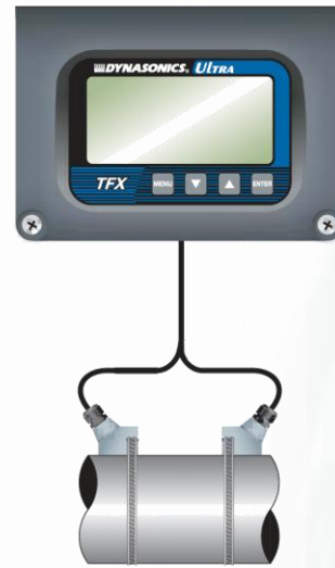
2" ve üstü ebatlar için Remote Göstergeli

S-METER SAYAC OTOMASYON SİSTEMLERİ SAN.TİC.LTD.ŞTİ.