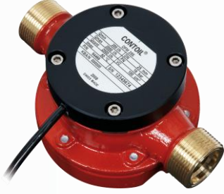
DFM 25 S Model Sayaç