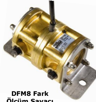
DFM8 Fark Ölçüm Sayacı